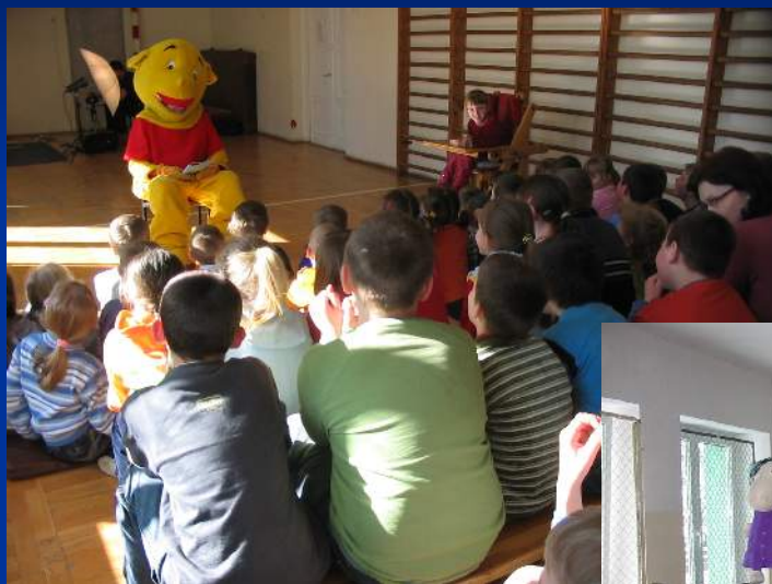
„Kubuś” nam czyta

Podziwiamy piękno muzyki klasycznej i występy prawdziwych artystów