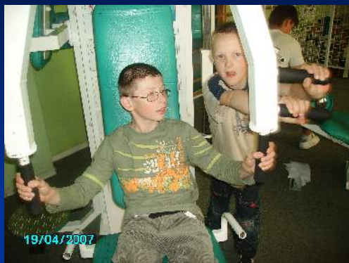
Ćwiczymy na siłowni