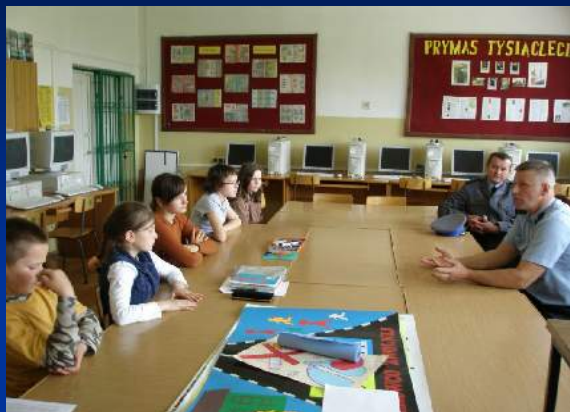
Spotkania z policjantami