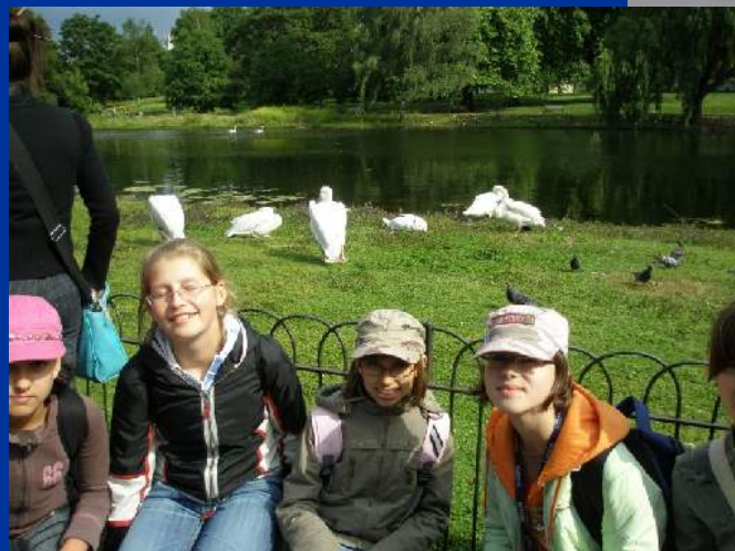
St James's Park - najstarszy park królewski z rezerwatem ptactwa egzotycznego