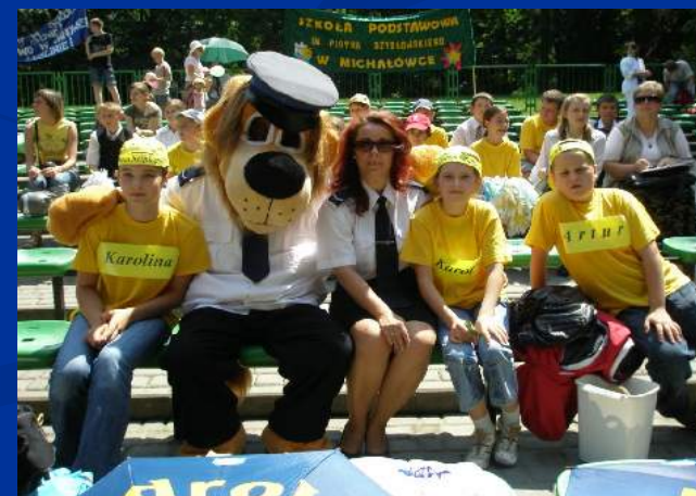
II miejsce - VII Wojewódzki Finał Konkursu w Lublinie