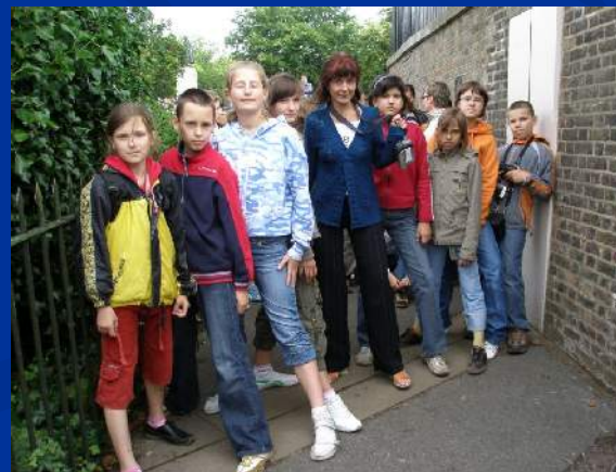
Byliśmy na południku "zero" w Greenwich