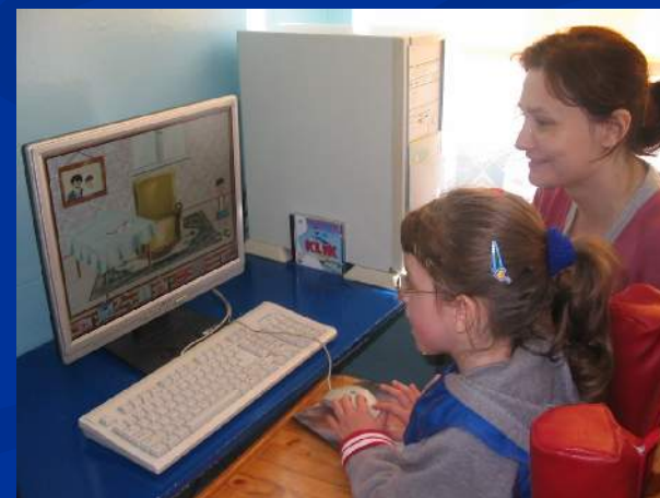
Pracujemy z Klikiem