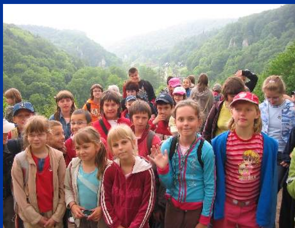
Na szlaku w Tatrach