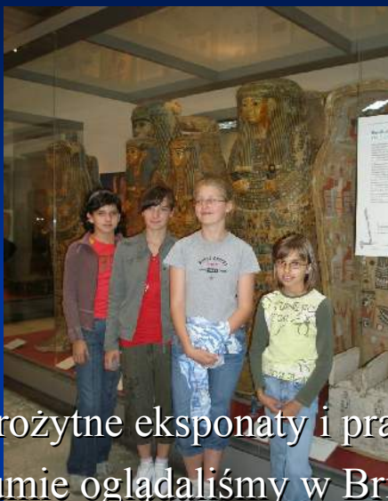
Starożytne eksponaty i prawdziwe mumie oglądaliśmy w British Museum