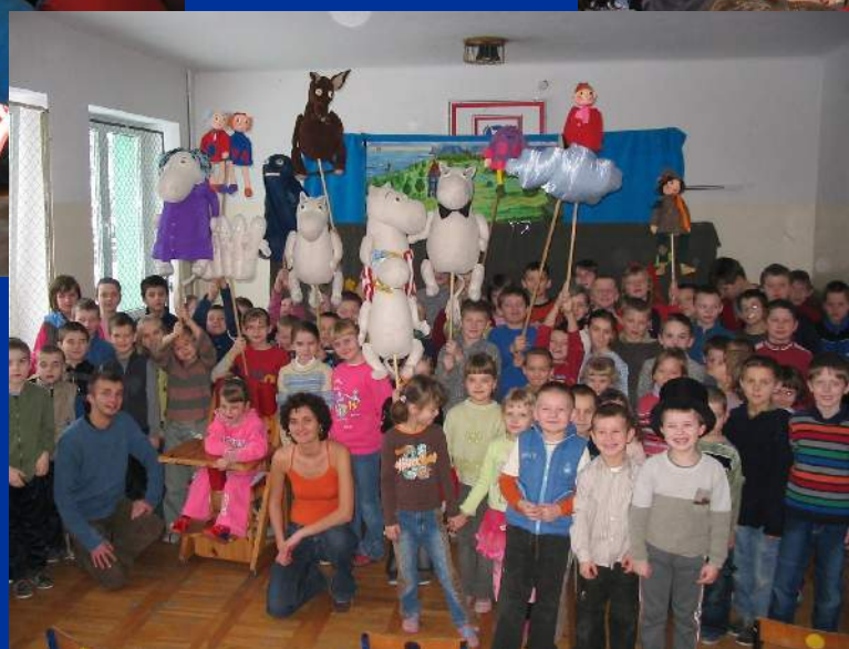
Teatrzyk kukielkowy „Muminki”