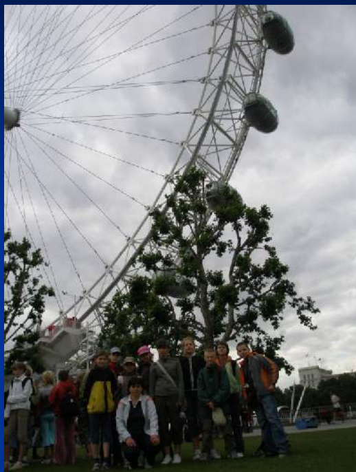
London Eye - ogromnego tzw. "diabelskiego młynu"

Houses of Parliament z charakterystyczną wieżą zegarową i słynnym Big Benem