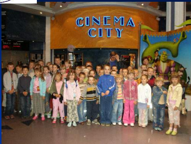
W kinie trójwymiarowym