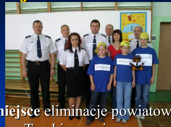
I miejsce eliminacje powiatowe w Trzebieszowie