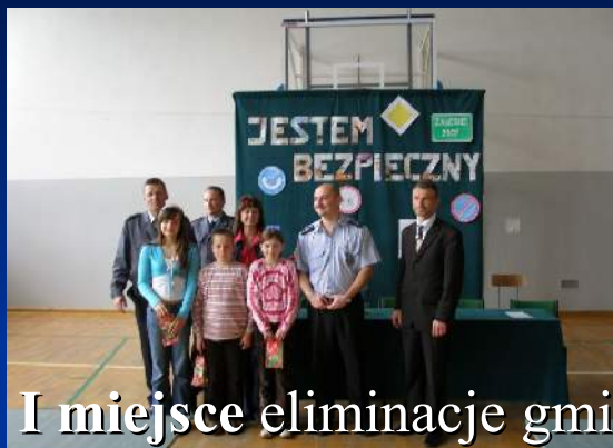
I miejsce eliminacje gminne w Zespole Szkół w Zalesiu