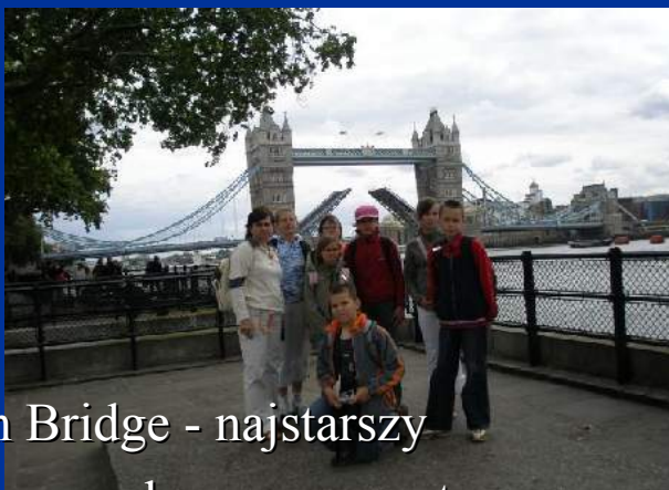
London Bridge - najstarszy działający podnoszony most