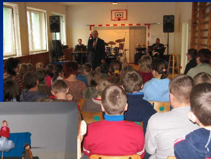
Koncert zespołu "LIMBOS"