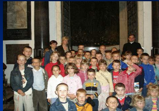
Przed grobem naszego Patrona Stefana Wyszyńskiego