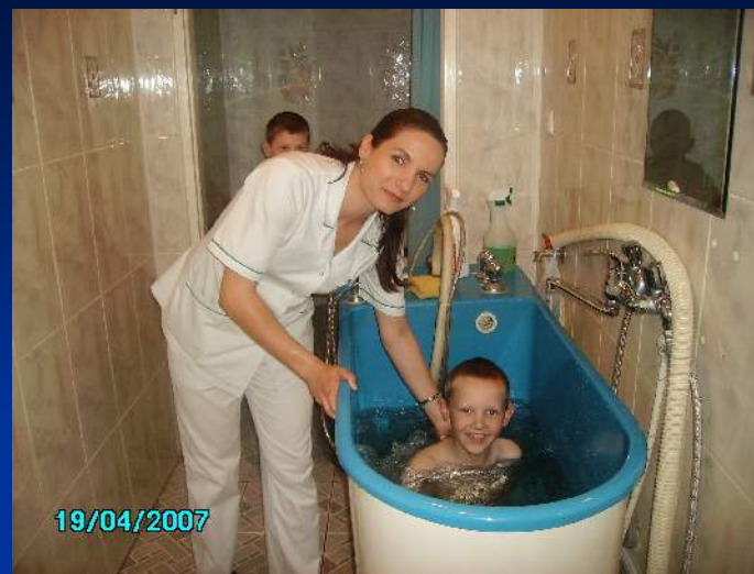
Doświadczamy masażu wodnych