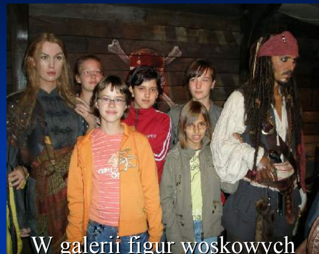
W galerii figur woskowych Madame Tussaud's