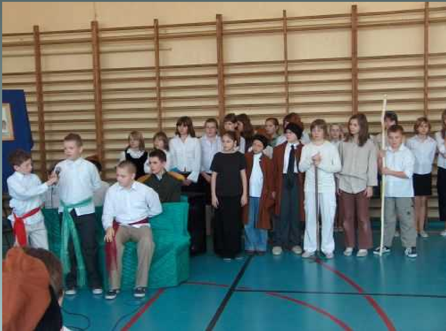
Koło dziennikarsko – teatralne apel z okazji rocznicy uchwalenia Konstytucji 3 Maja