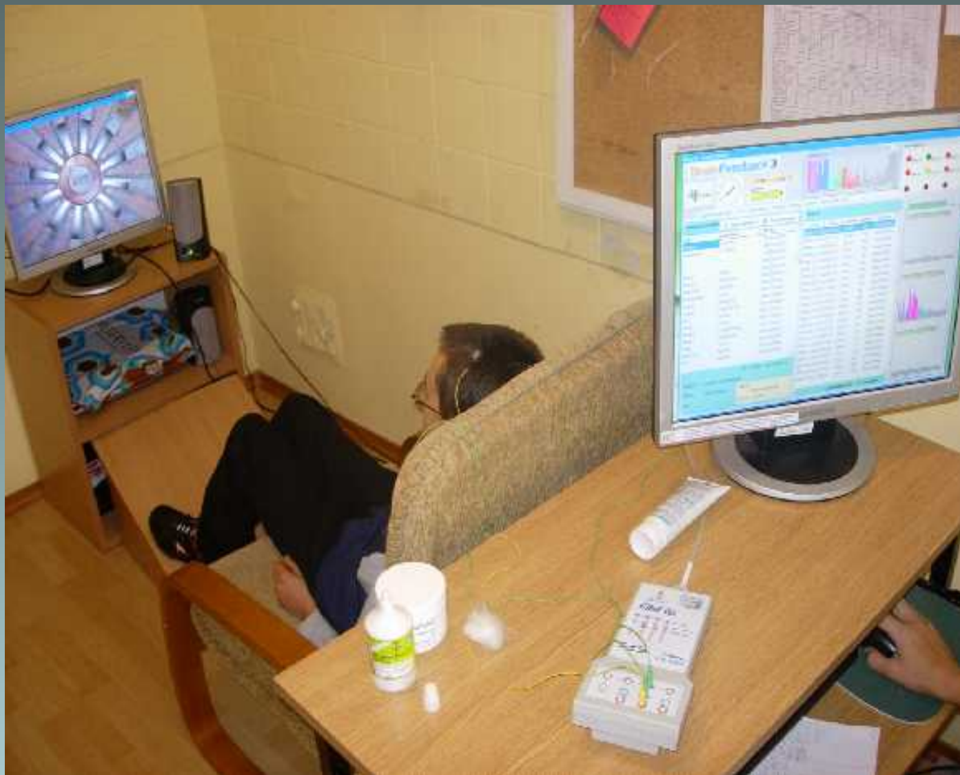
Świetlica socjoterapeutyczna - terapia EEG metodą Biofeedbecka-