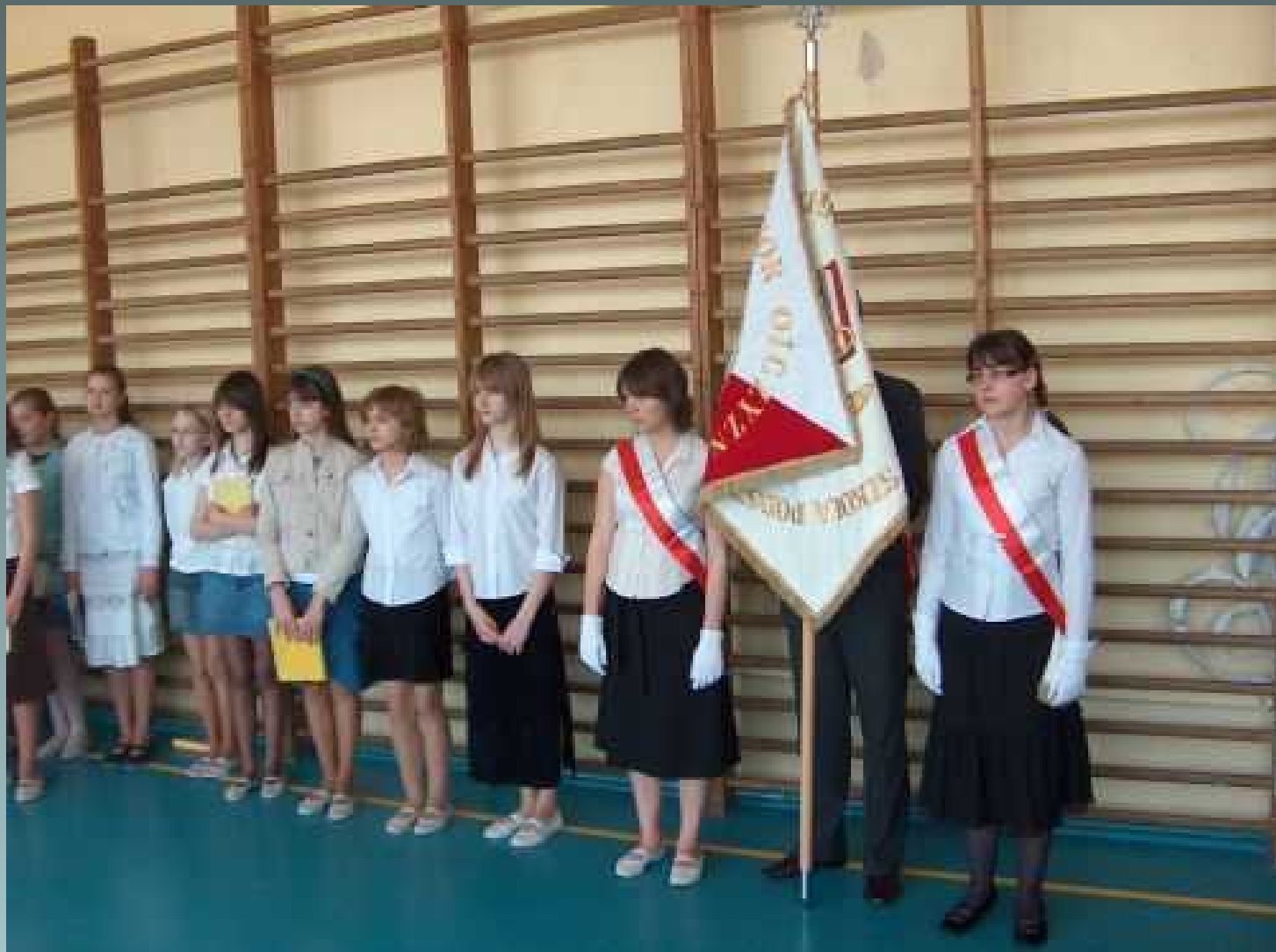
Koło dziennikarsko – teatralne apel z okazji rocznicy uchwalenia Konstytucji 3 Maja