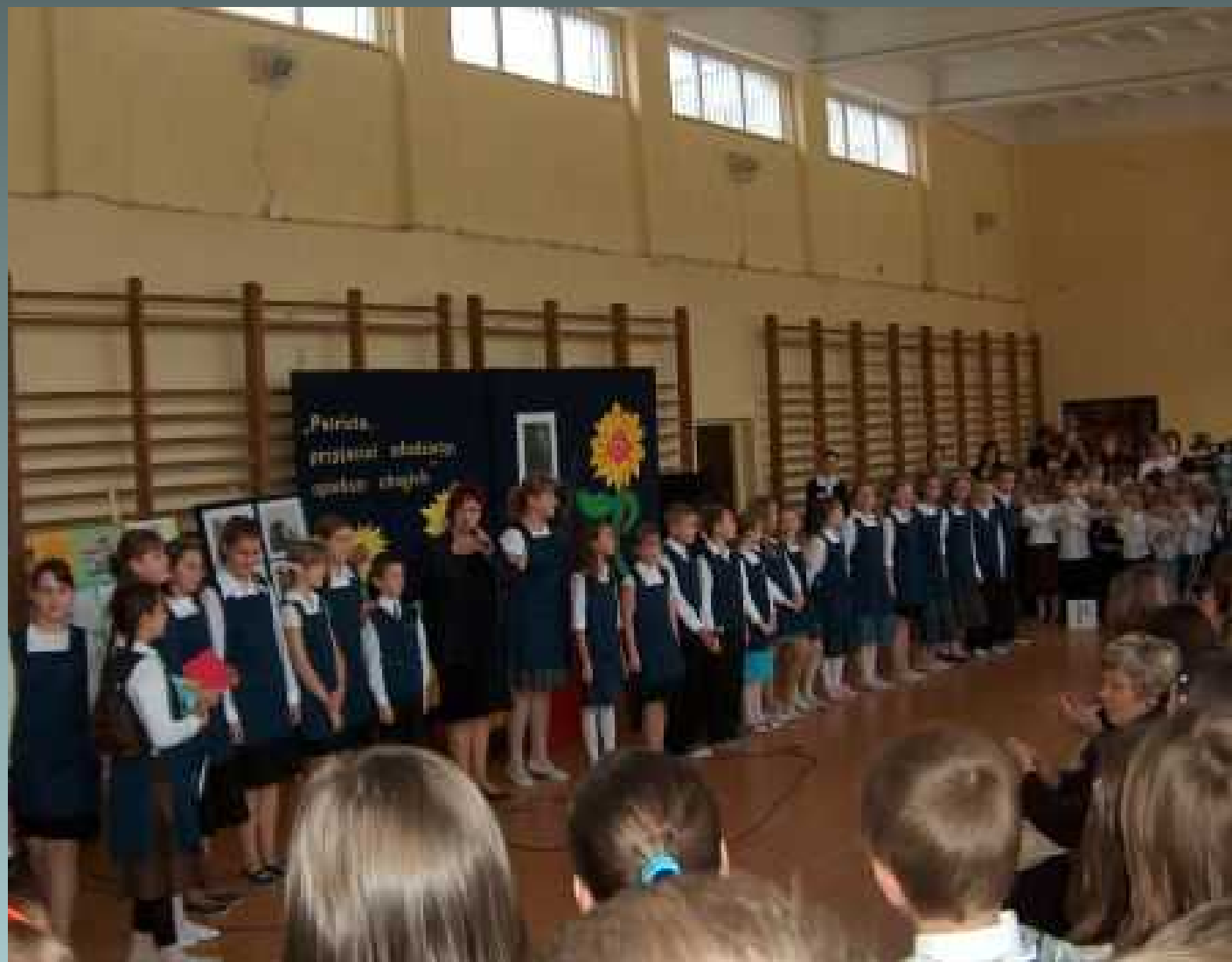
Koło dziennikarsko – teatralne - Święto Szkoły -