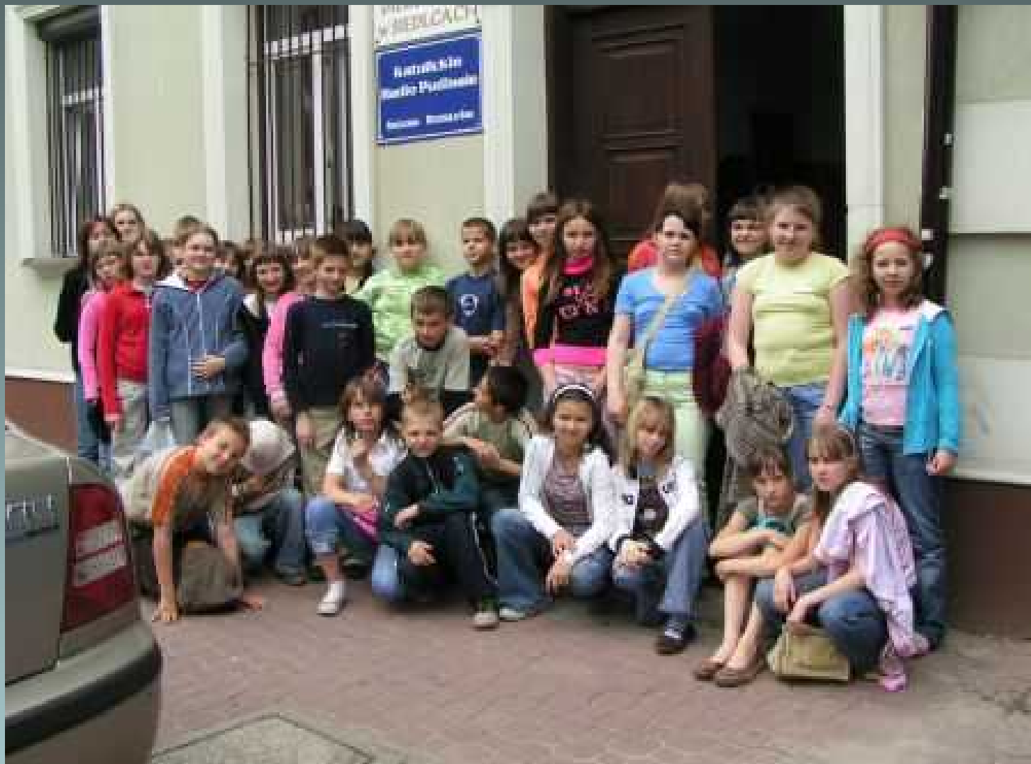
Koło dziennikarsko – teatralne - wycieczka do Katolickiego Radia Podlasia -