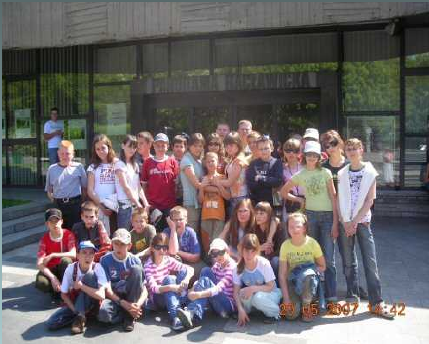
Obóz rehabilitacyjno - rekreacyjny