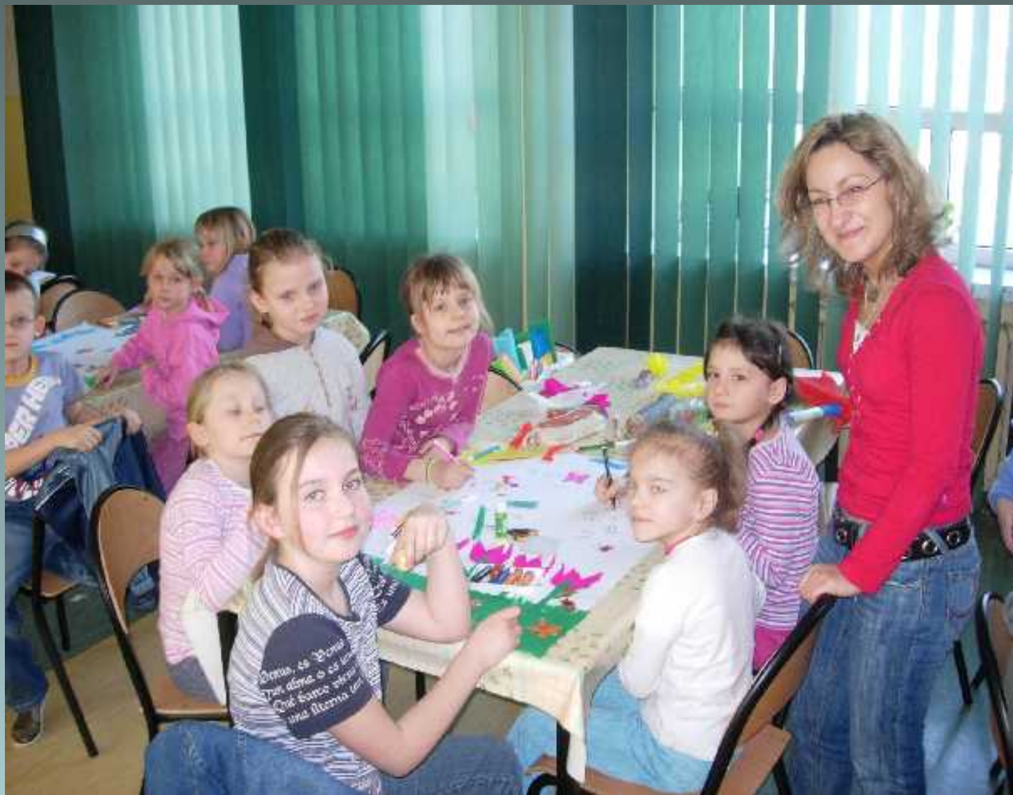
Programy rozwijające zainteresowania i zdolności uczniów w klasach I-III koło plastyczne