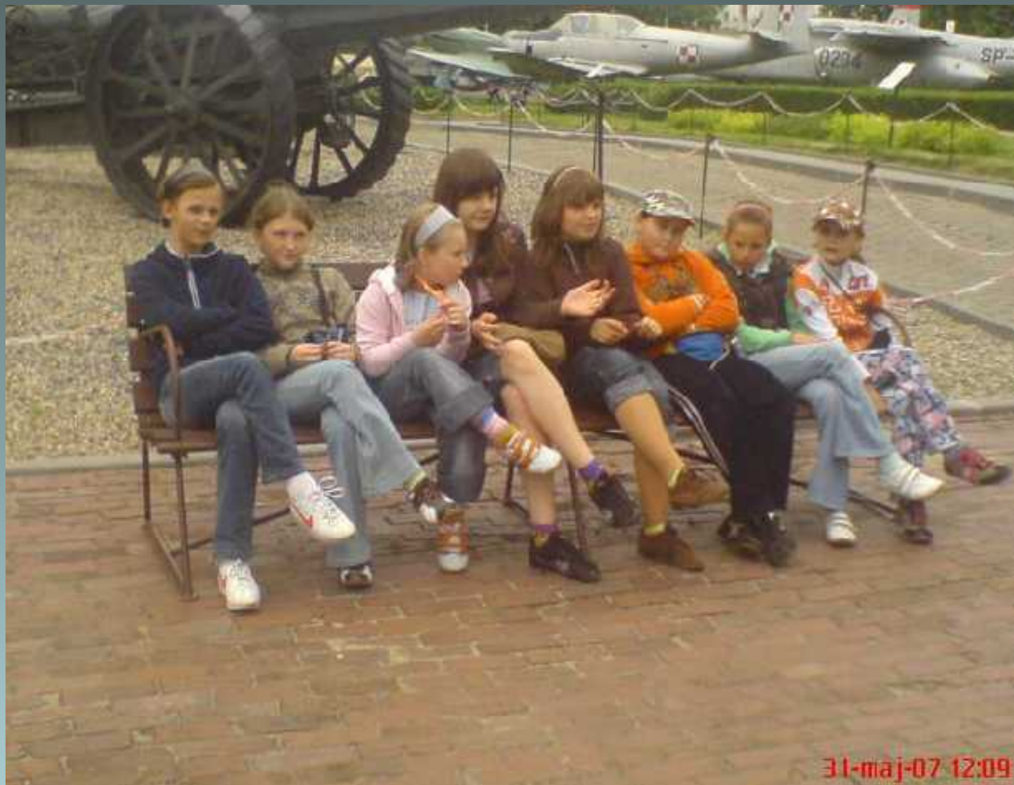
Kształcenie politechniczno-historyczne wycieczka do Muzeum Wojska Polskiego