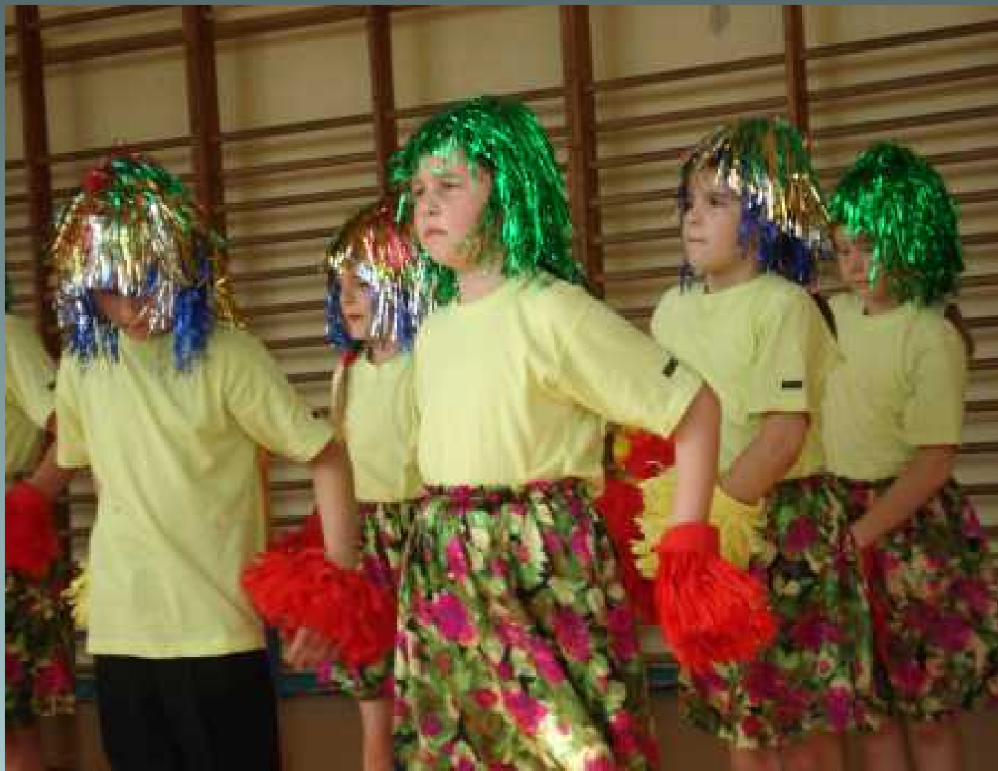
Programy rozwijające zainteresowania i zdolności uczniów w klasach I-III - koło taneczne -