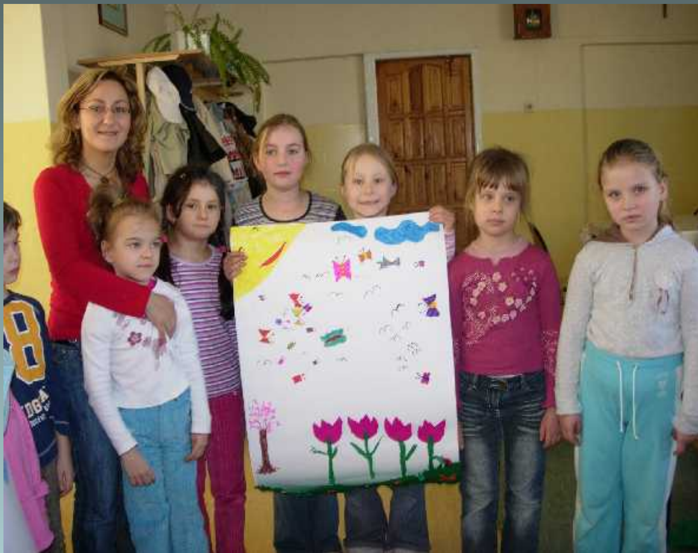
Programy rozwijające zainteresowania i zdolności uczniów w klasach I-III koło plastyczne