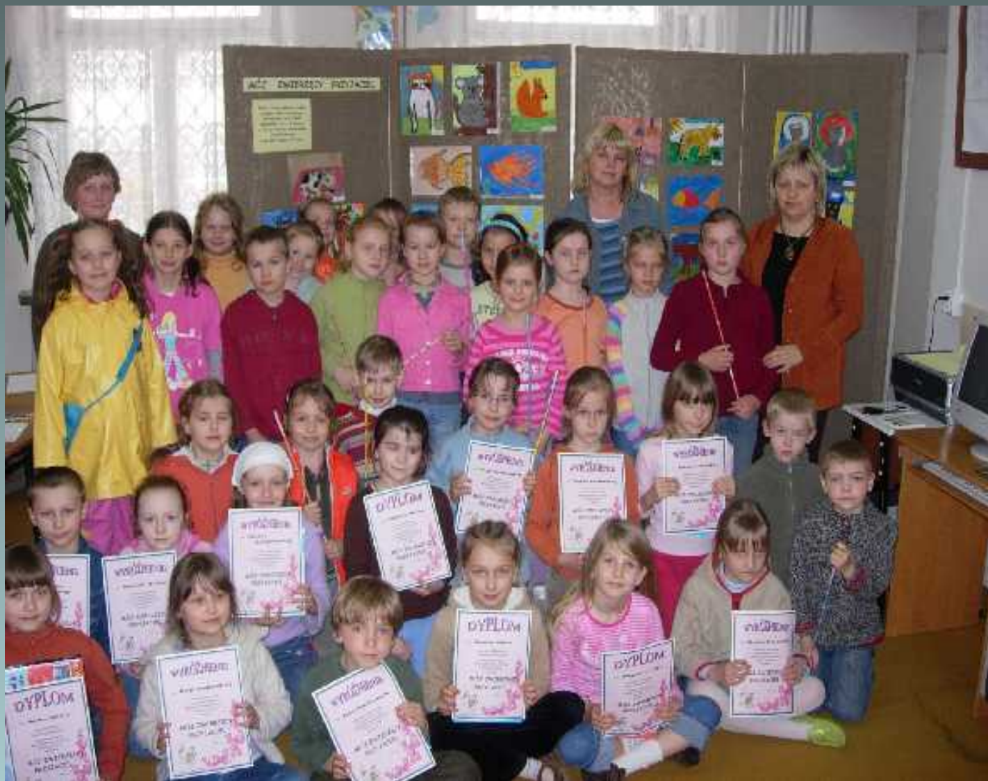
Programy rozwijające zainteresowania i zdolności uczniów w klasach I-III koło plastyczne