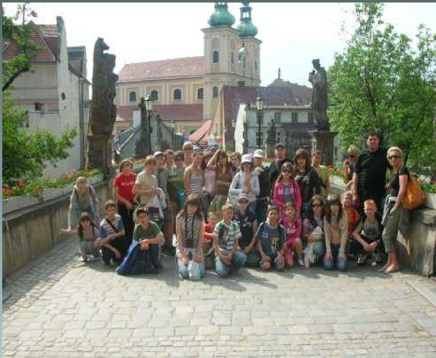
Obóz rehabilitacyjno - rekreacyjny