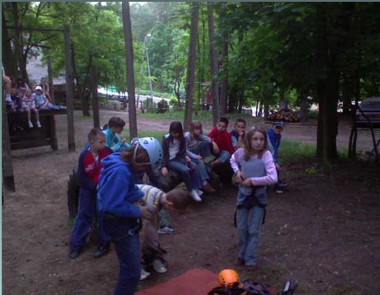
Szkoła Przetrwania - Serpelice