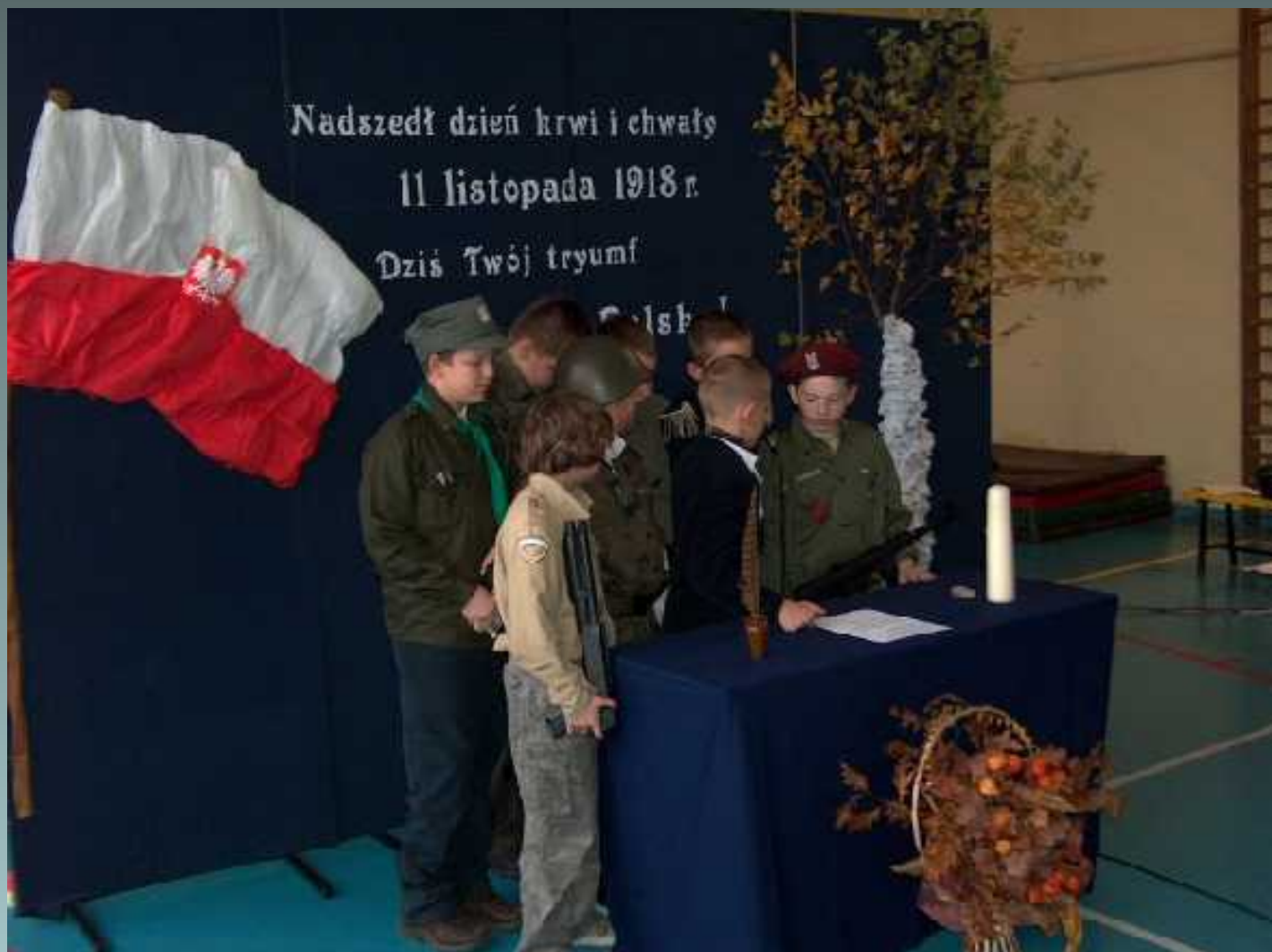
Koło dziennikarsko – teatralne apel z okazji obchodów Święta Niepodległości