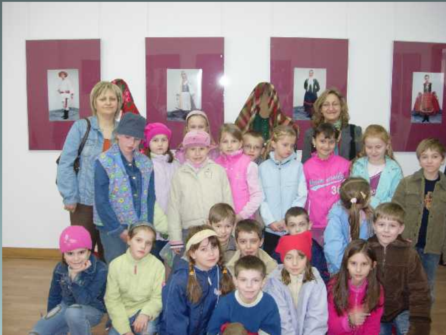
Programy rozwijające zainteresowania i zdolności uczniów w klasach I-III wycieczka do muzeum