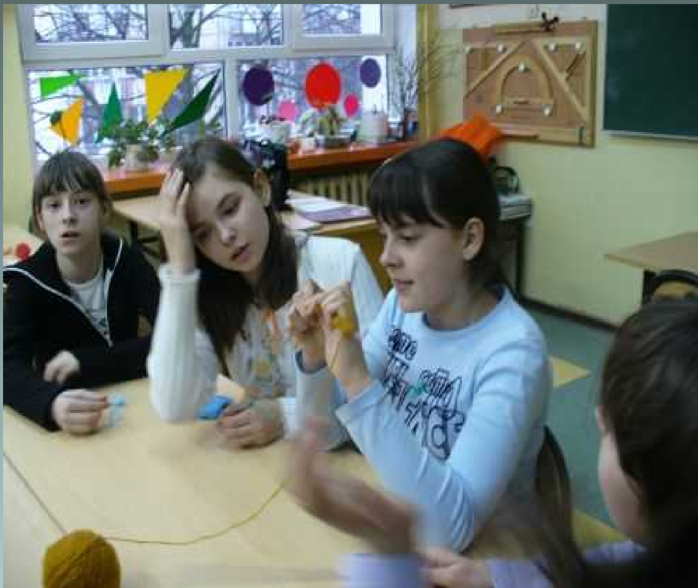
Świetlica socjoterapeutyczna - robótki ręczne-