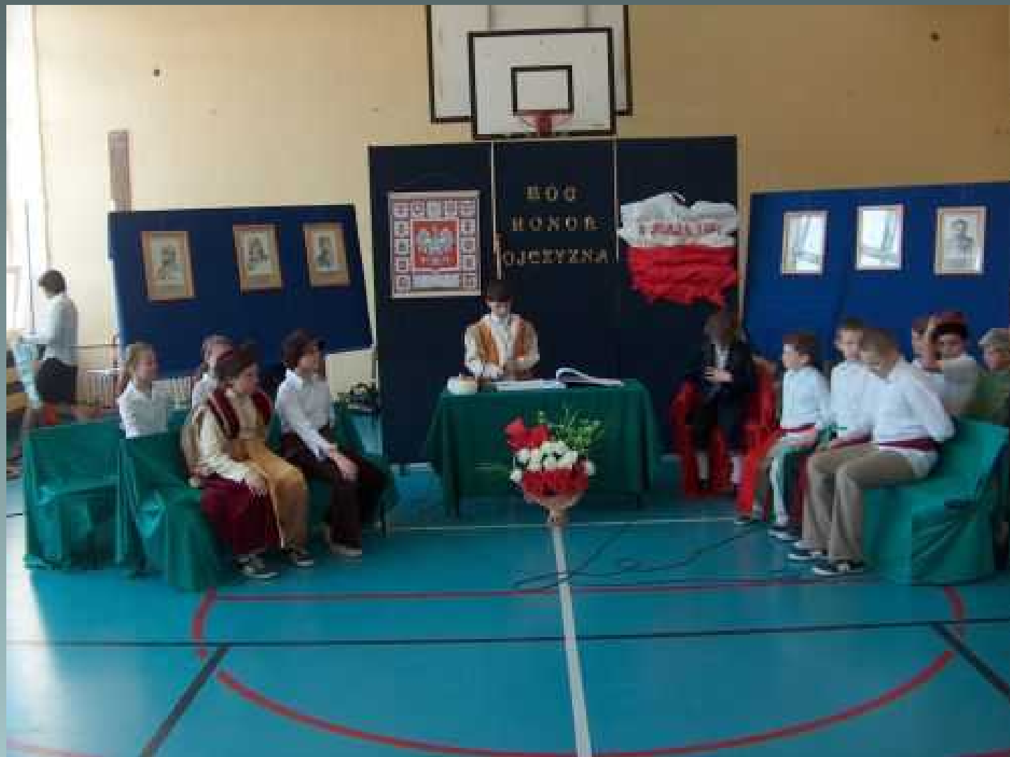
Koło dziennikarsko – teatralne apel z okazji rocznicy uchwalenia Konstytucji 3 Maja