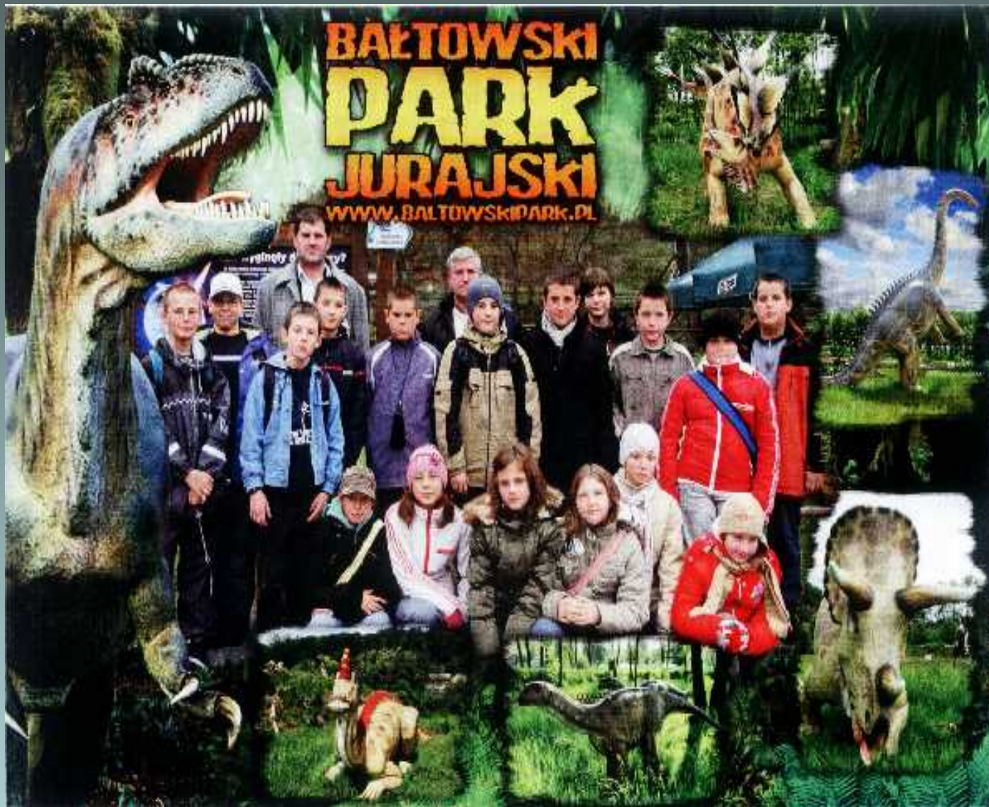
Kształcenie politechniczno-historyczne wycieczka do Bałtowa