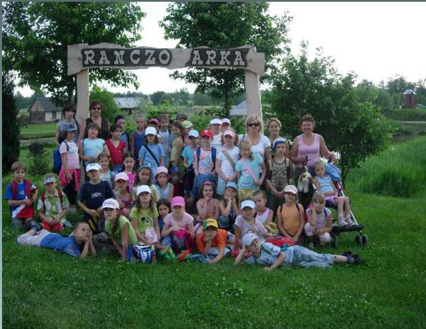
Programy rozwijające zainteresowania i zdolności uczniów w klasach I-III wycieczka do Sernik