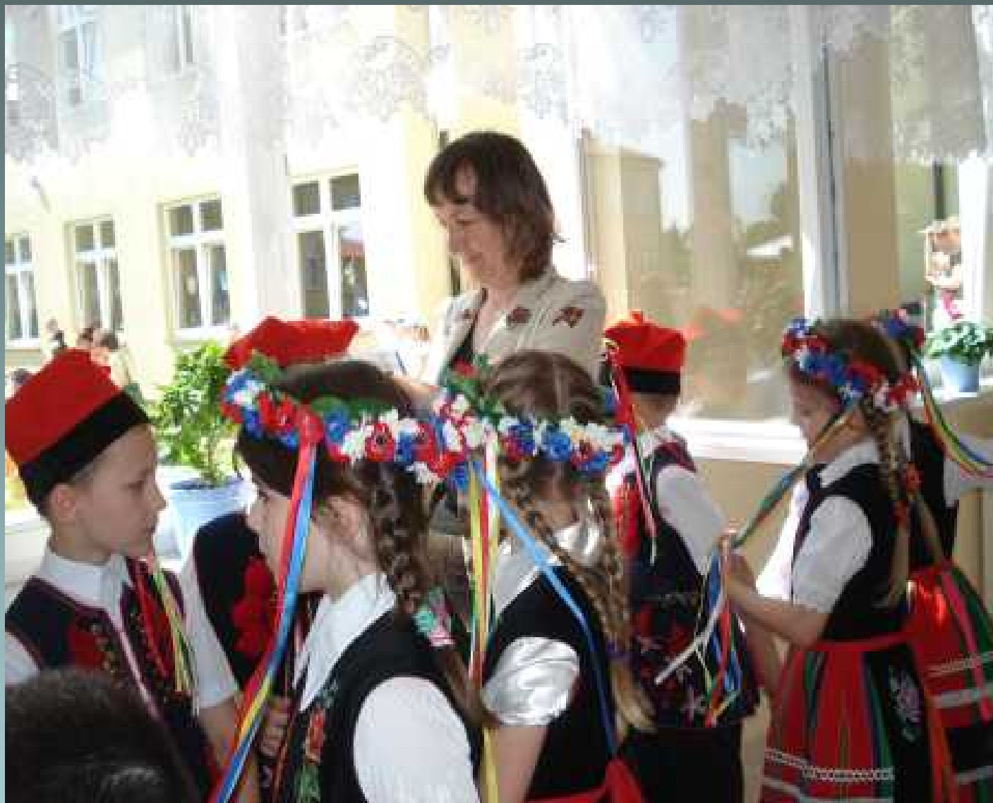
Programy rozwijające zainteresowania i zdolności uczniów w klasach I-III - koło taneczne -