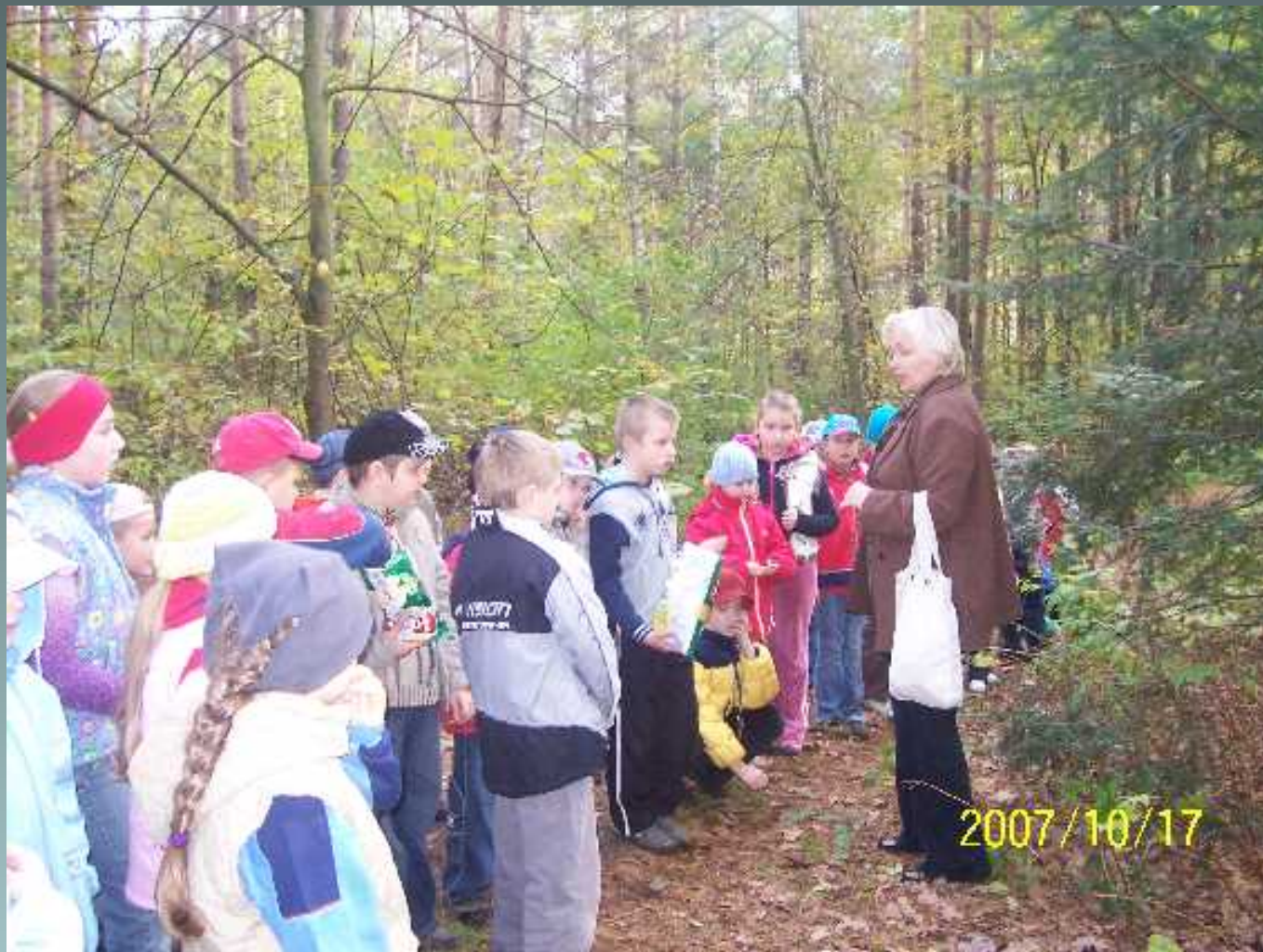
Programy rozwijające zainteresowania i zdolności uczniów w klasach I-III wycieczka do lasu