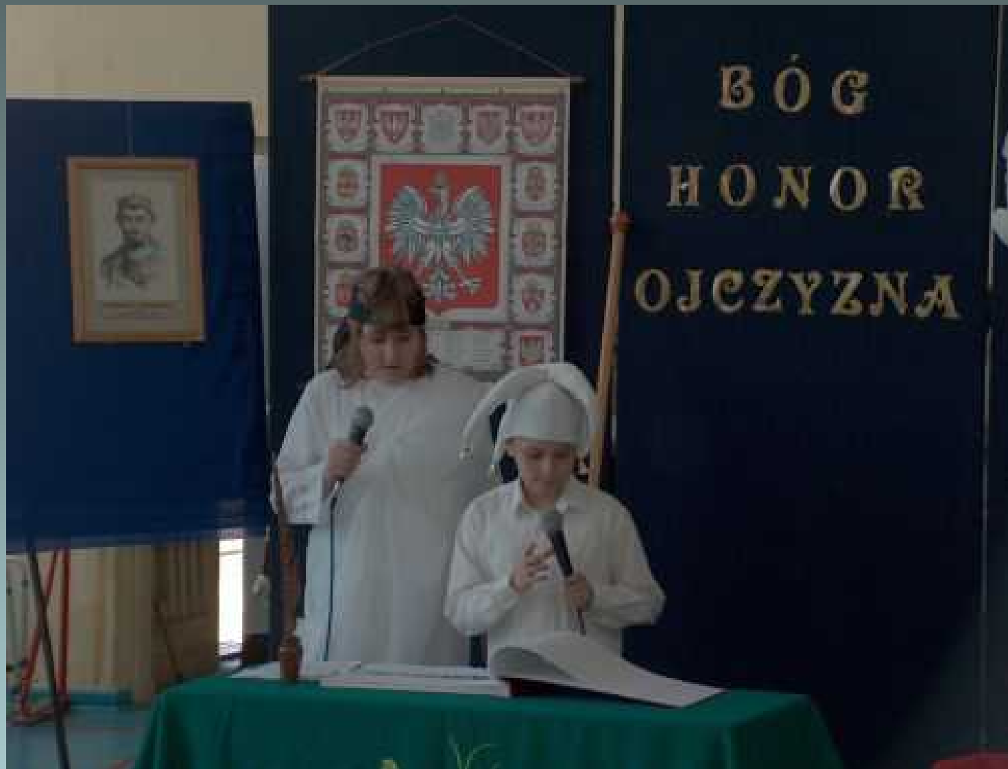
Koło dziennikarsko – teatralne apel z okazji rocznicy uchwalenia Konstytucji 3 Maja