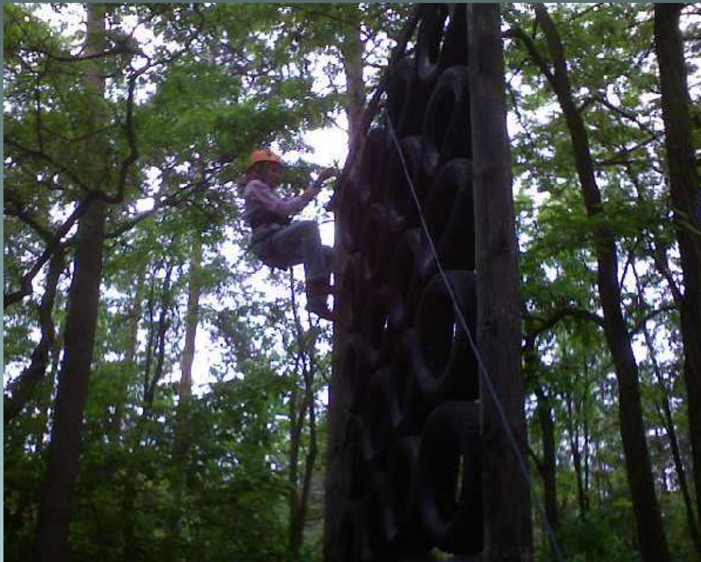
Szkoła Przetrwania - Serpelice