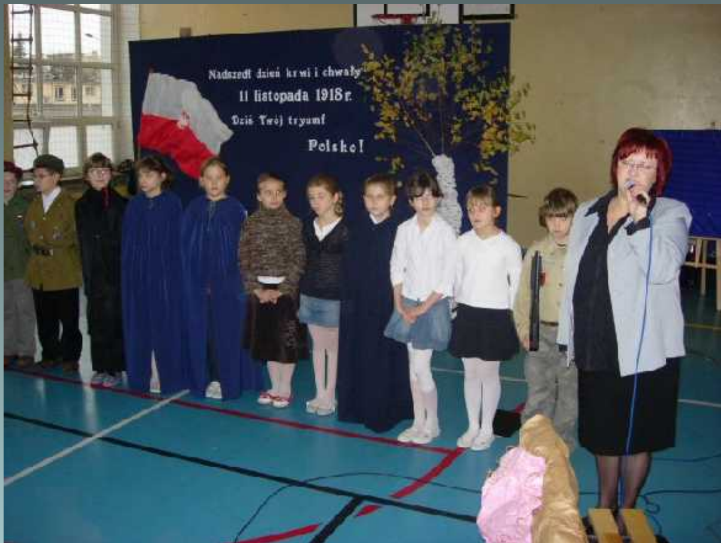
Koło dziennikarsko – teatralne apel z okazji obchodów Święta Niepodległości