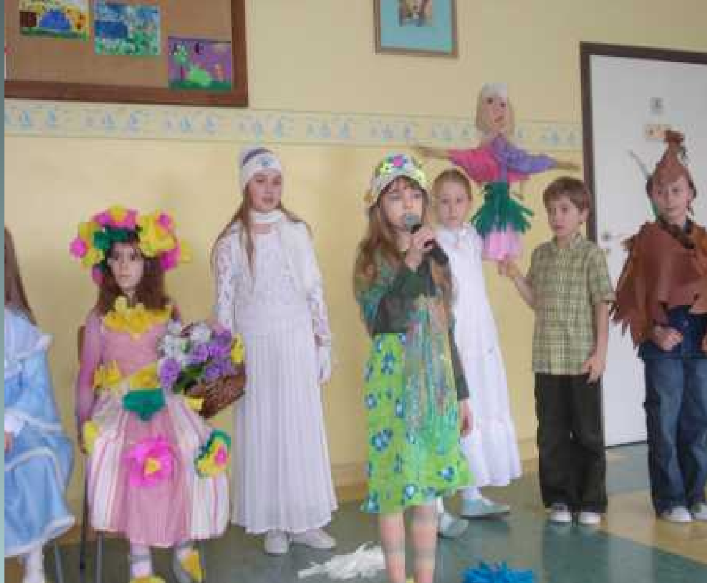
Programy rozwijające zainteresowania i zdolności uczniów w klasach I-III - koło taneczne -