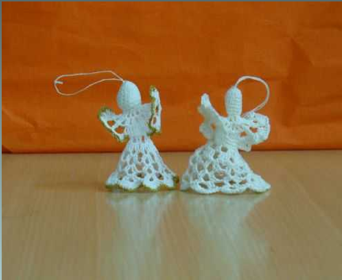
Świąteczna socjoterapeutyczna - robótki ręczne-