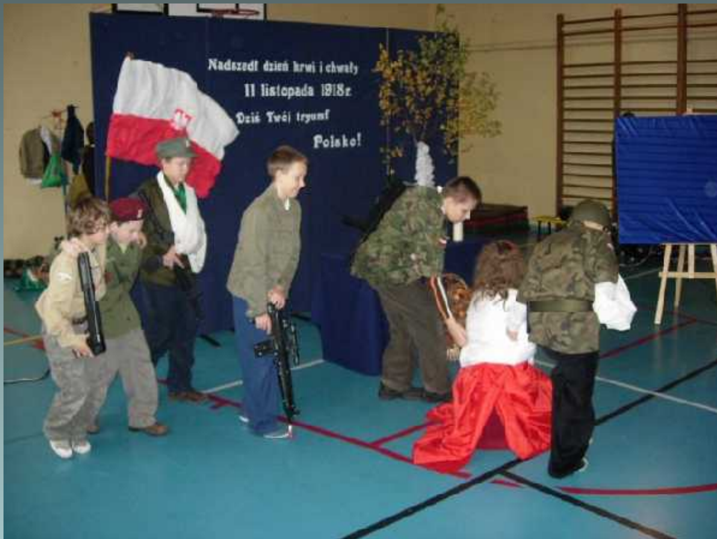
Koło dziennikarsko – teatralne apel z okazji obchodów Święta Niepodległości