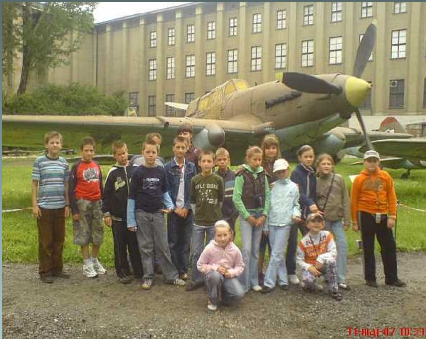
Kształcenie politechniczno-historyczne wycieczka do Muzeum Wojska Polskiego