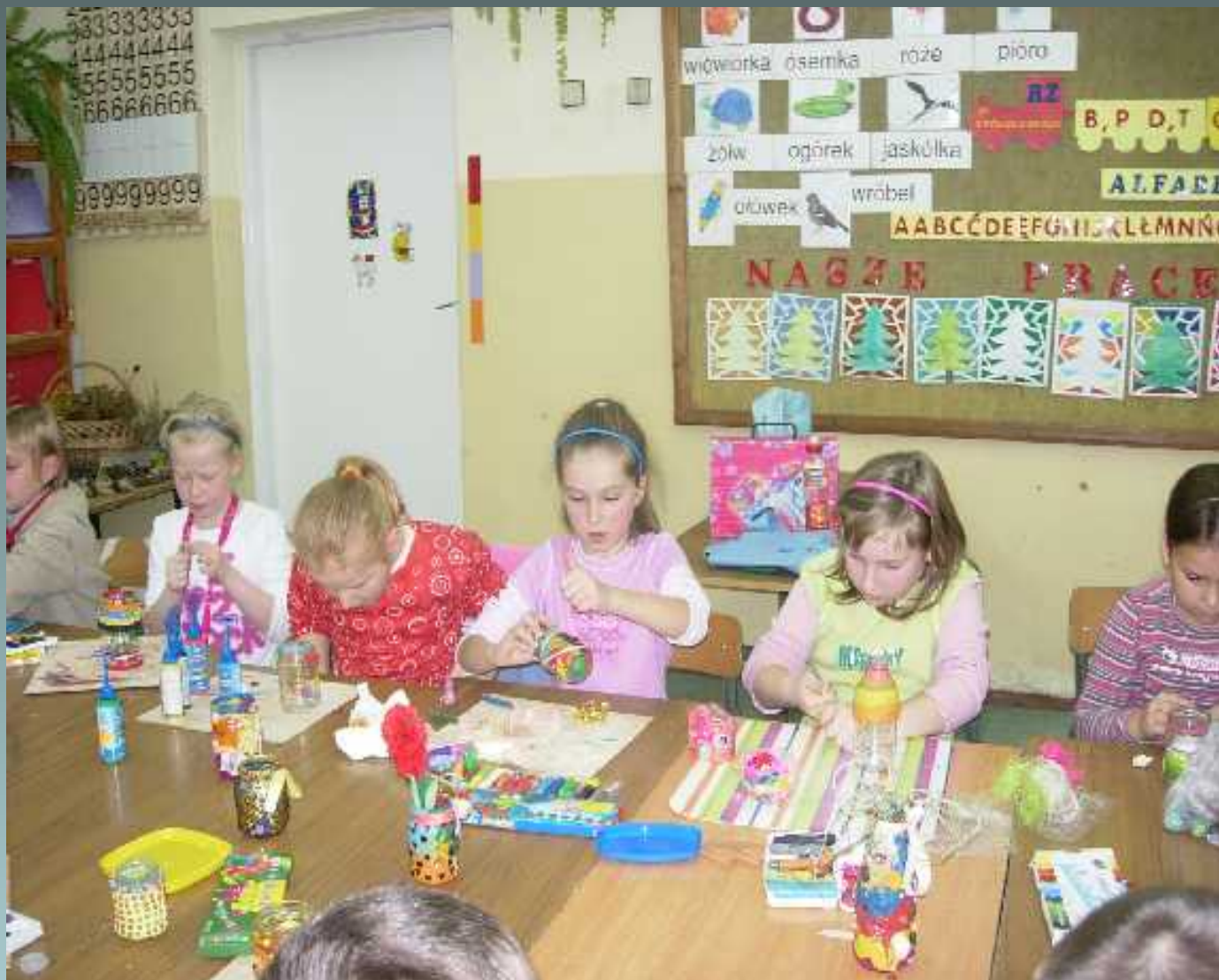
Programy rozwijające zainteresowania i zdolności uczniów w klasach I-III koło plastyczne