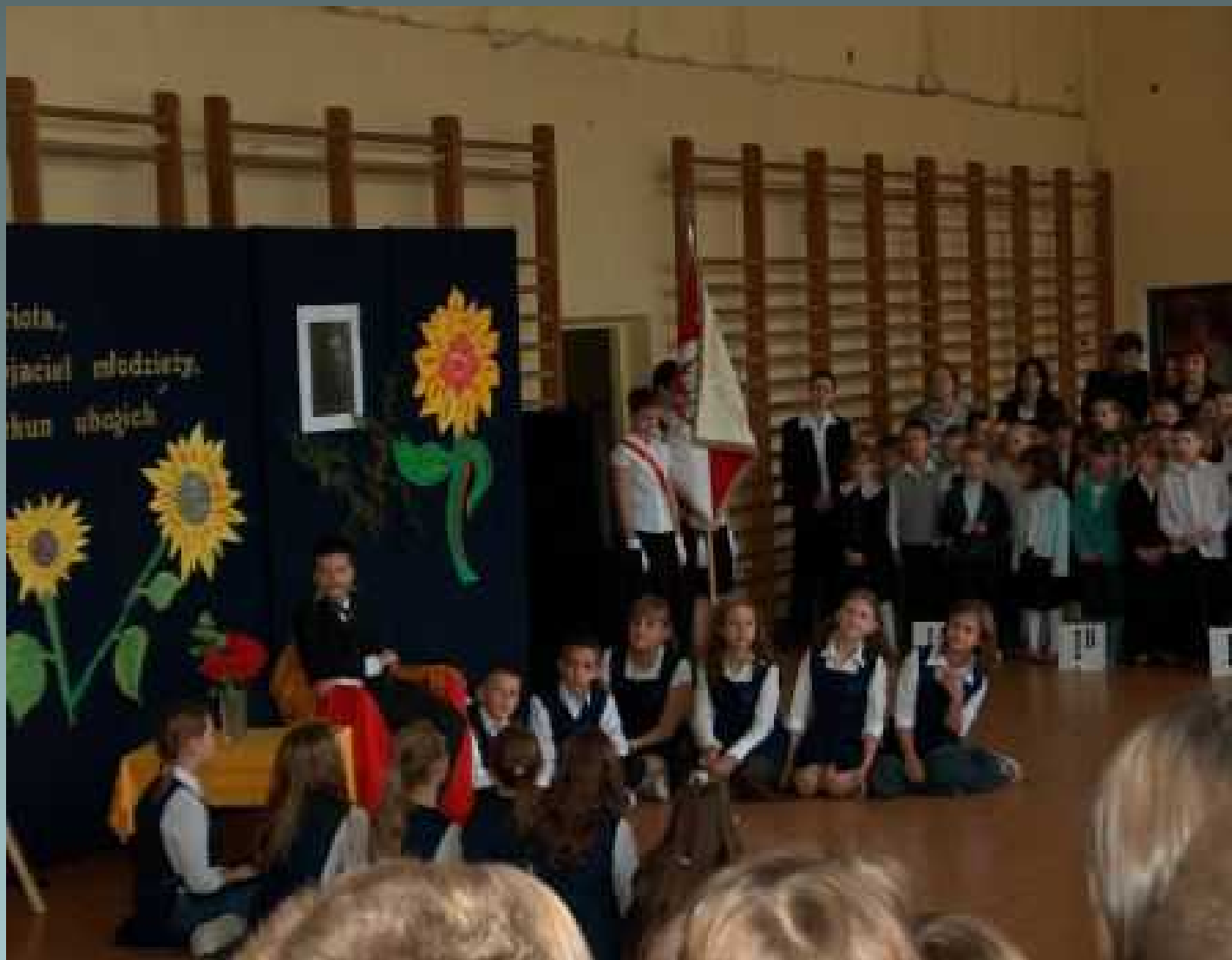
Koło dziennikarsko – teatralne - Święto Szkoły -