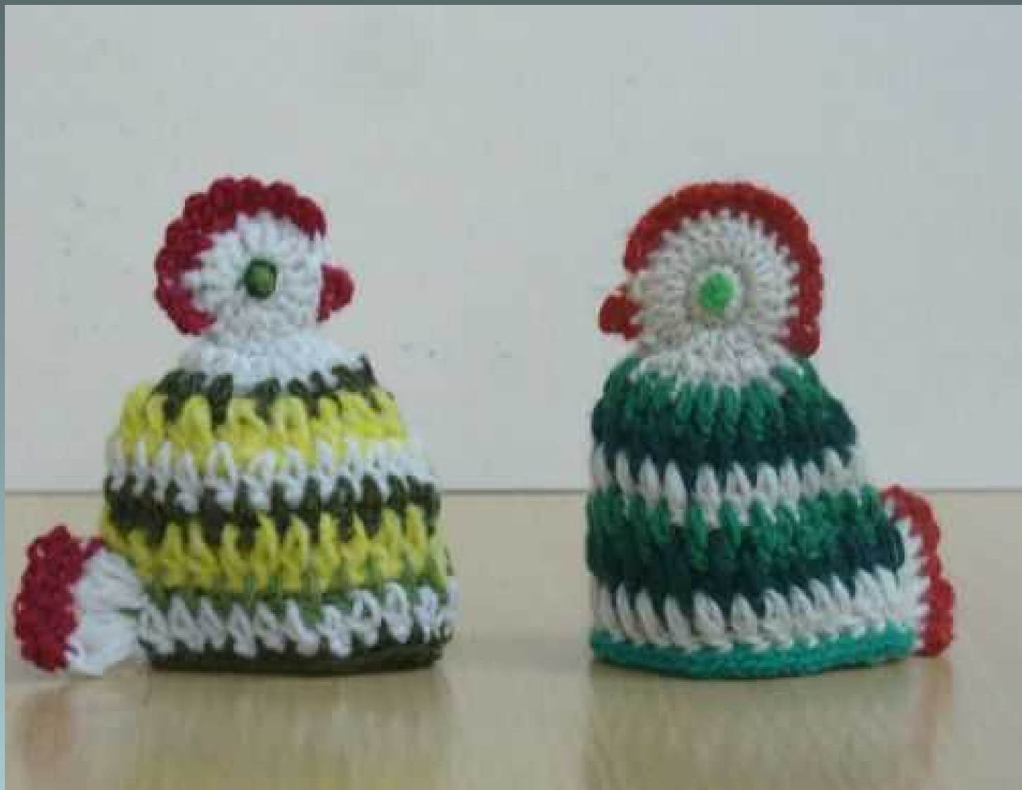
Świetlica socjoterapeutyczna - robótki ręczne -