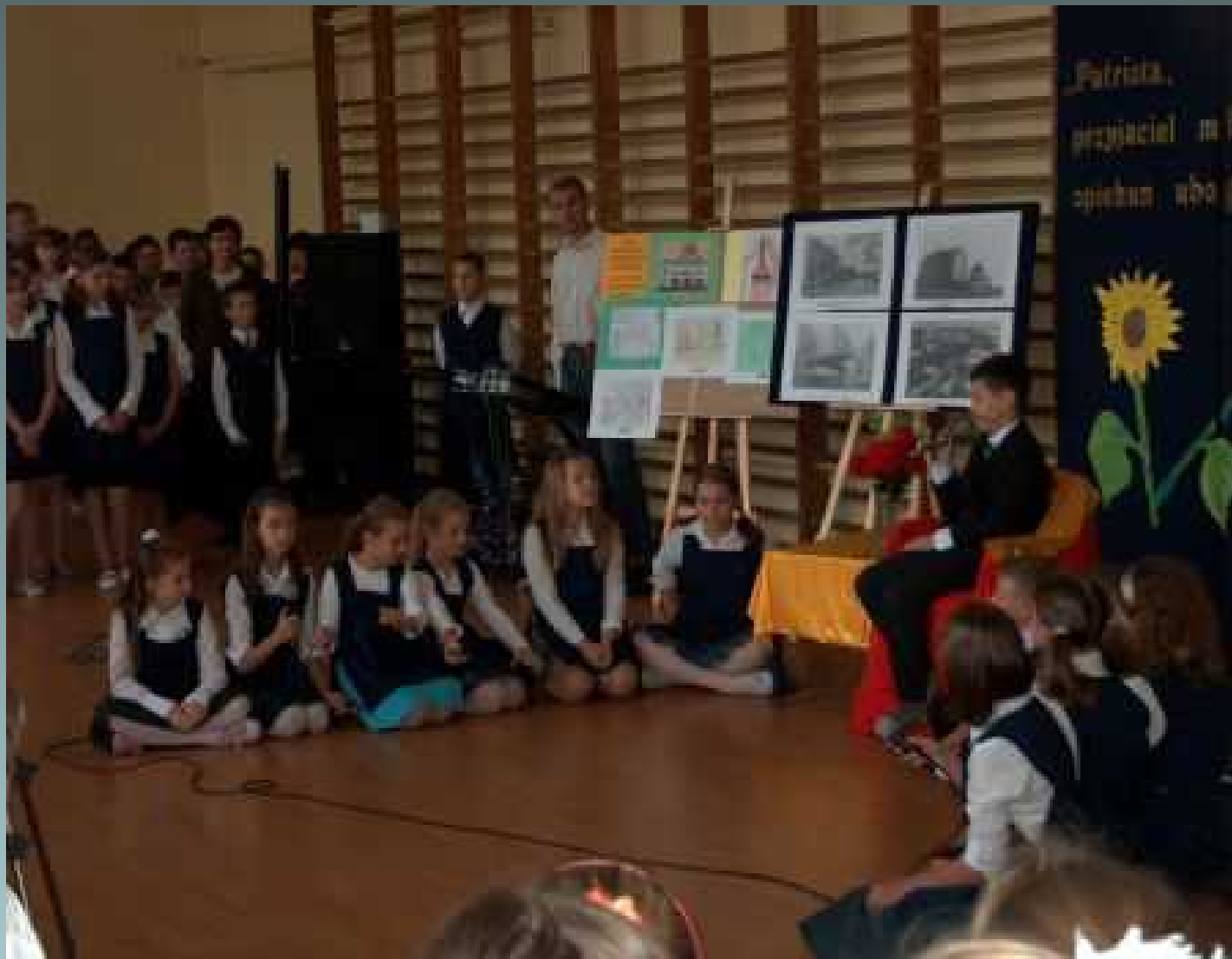
Koło dziennikarsko – teatralne - Święto Szkoły -