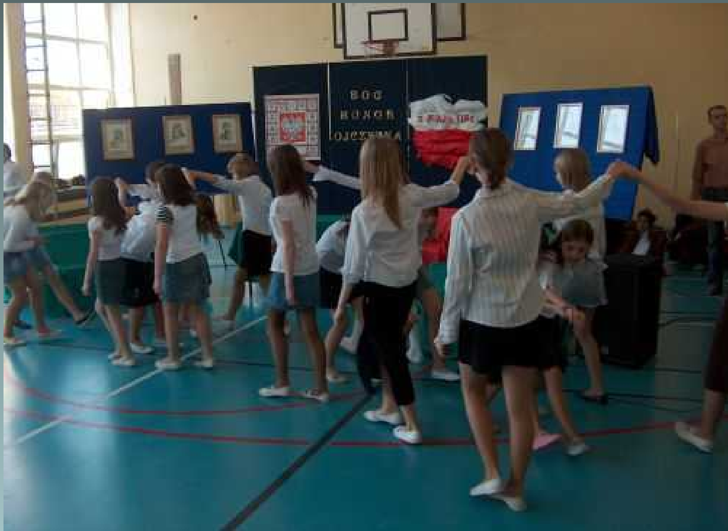
Koło dziennikarsko – teatralne apel z okazji rocznicy uchwalenia Konstytucji 3 Maja