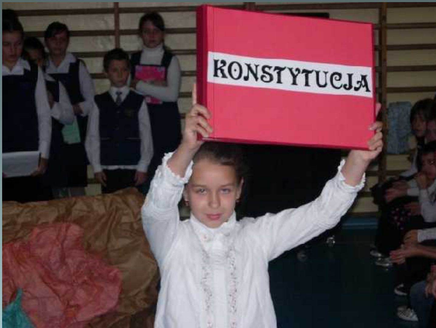
Koło dziennikarsko – teatralne apel z okazji rocznicy uchwalenia Konstytucji 3 Maja