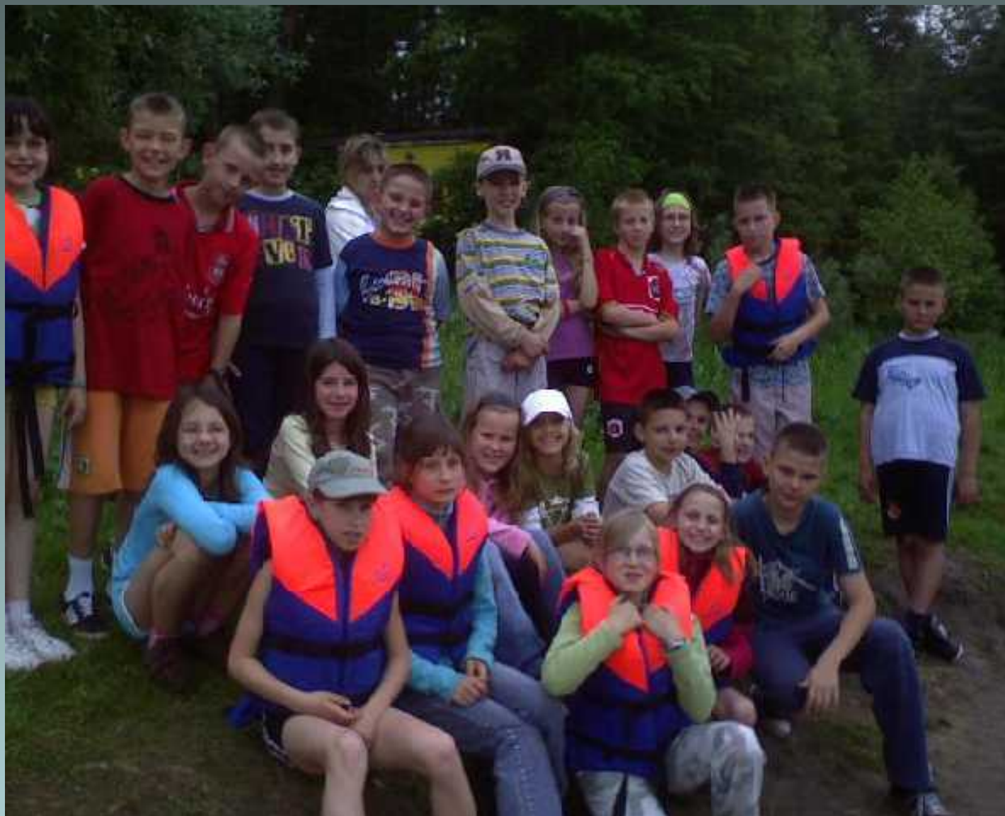
Szkoła Przetrwania - Serpelice