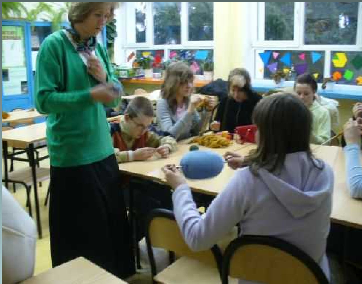
Świetlica socjoterapeutyczna - robótki ręczne-