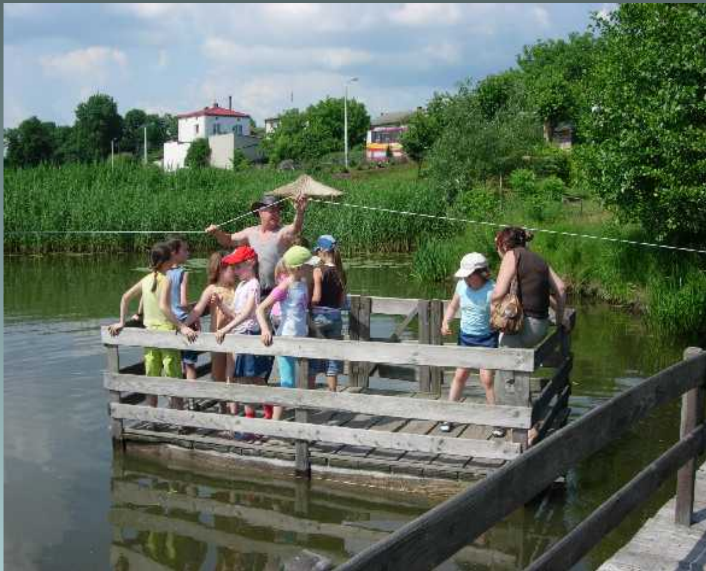
Programy rozwijające zainteresowania i zdolności uczniów w klasach I-III wycieczka do Sernik