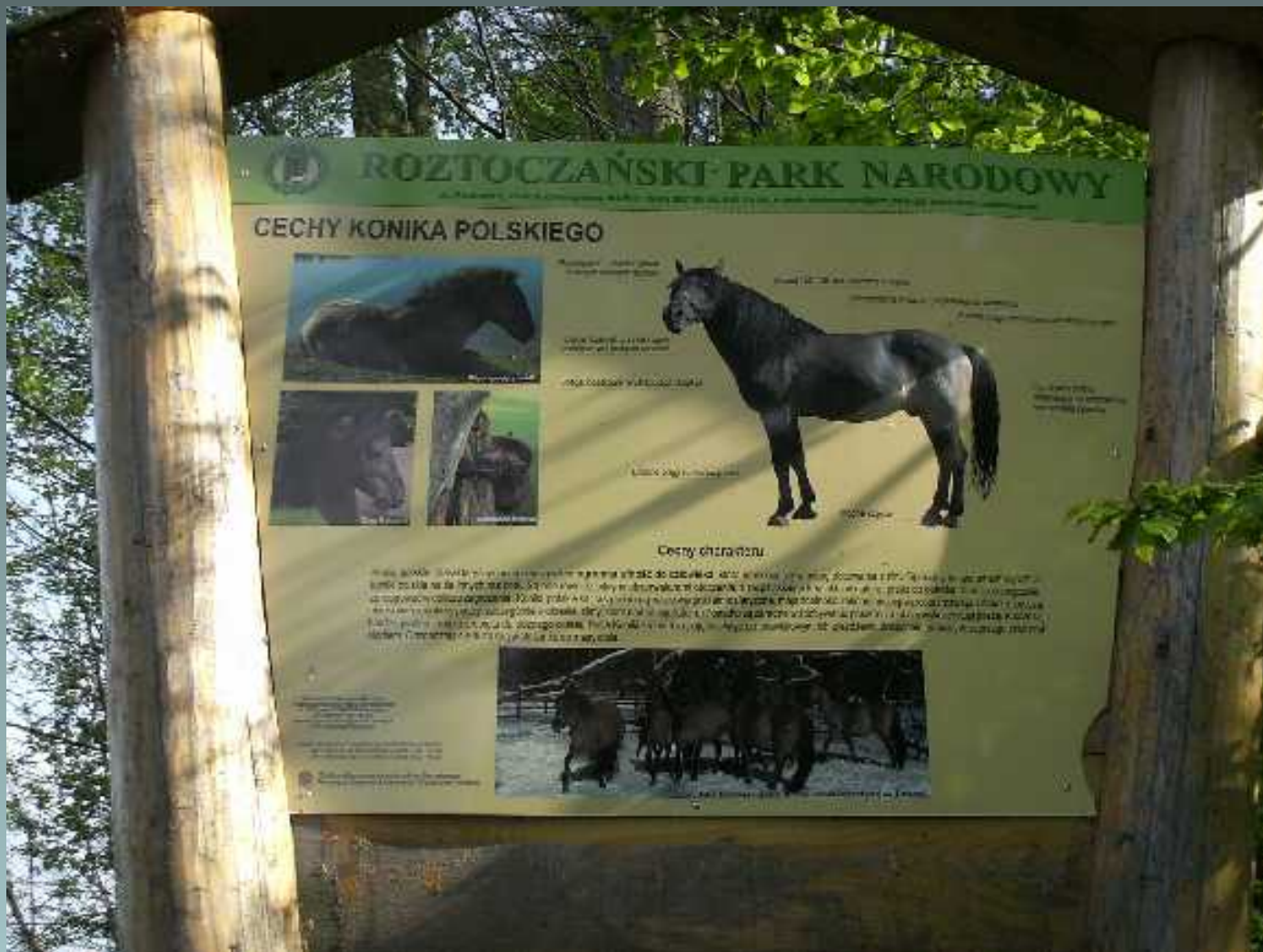
Świetlica socjoterapeutyczna Wycieczka do Zamościa i Roztoczańskiego Parku Narodowego