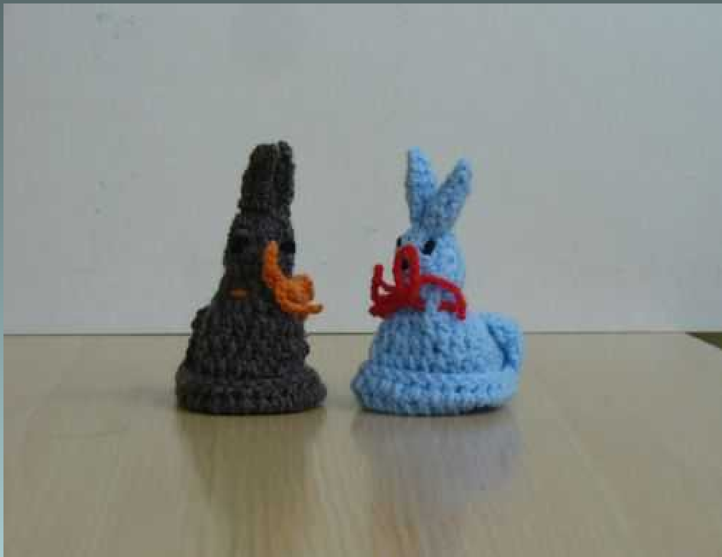
Świetlica socjoterapeutyczna - robótki ręczne-