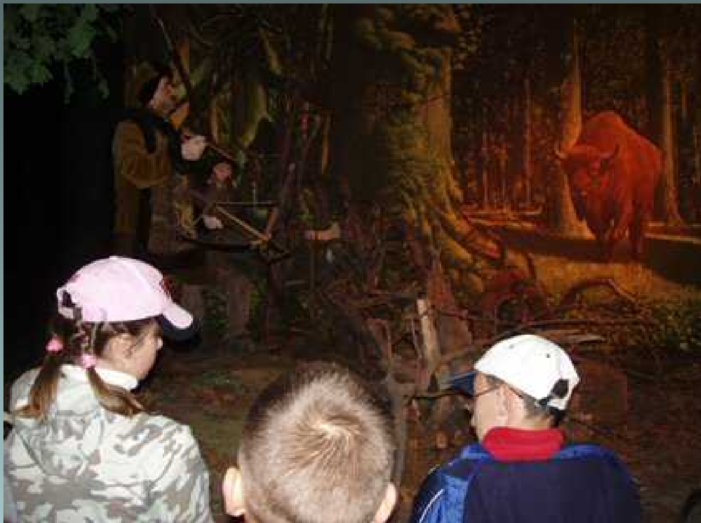
Program : Moja mała Ojczyzna wycieczka do Białowieży i Janowa Lubelskiego