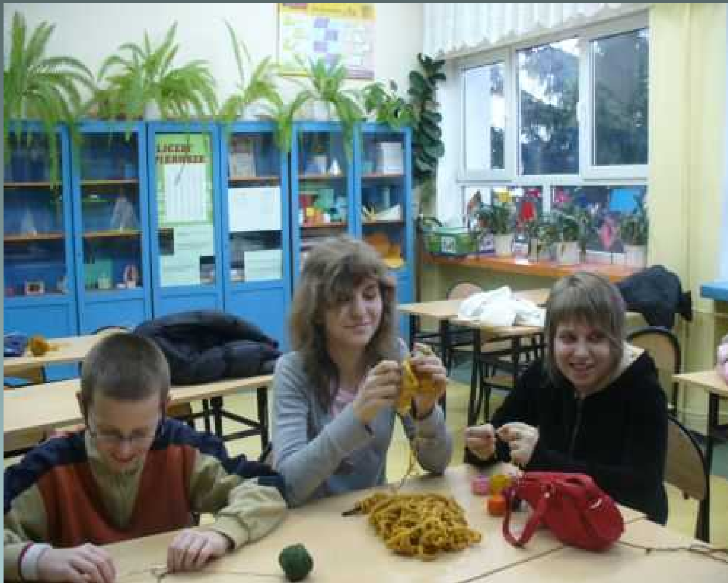
Świetlica socjoterapeutyczna - robótki ręczne-