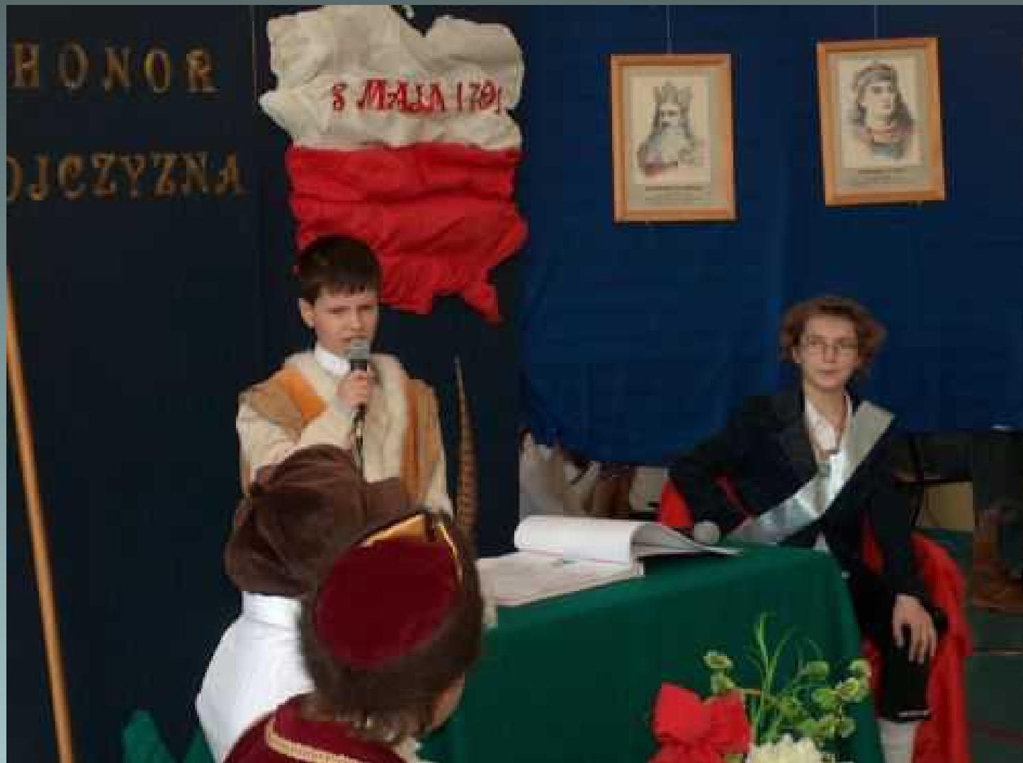
Koło dziennikarsko – teatralne apel z okazji rocznicy uchwalenia Konstytucji 3 Maja